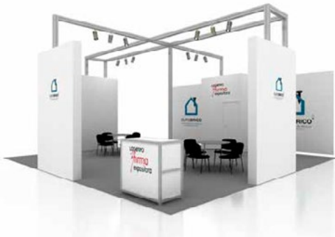
Diseño MUROS / WALLS design