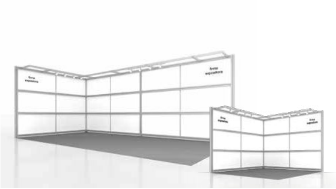
Predecorado BASIC / BASIC decoration