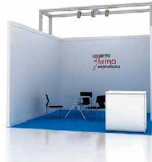
Diseño BASIC / BASIC design