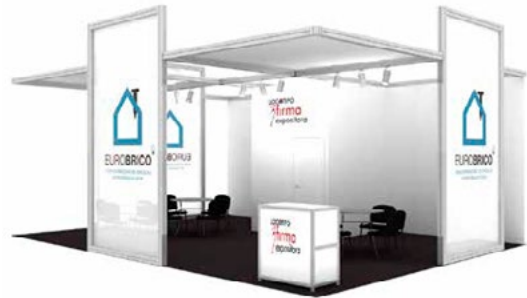
Diseño LONAS / CANVAS design