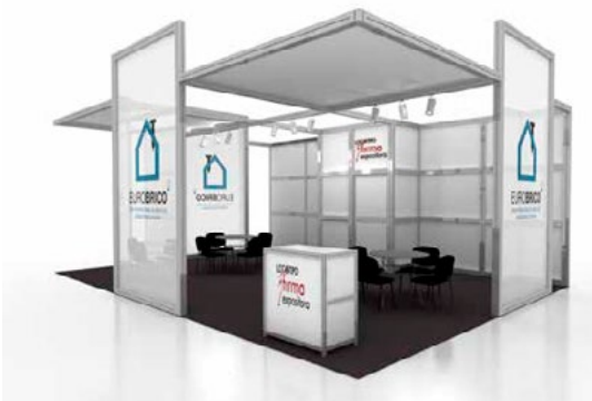
Predecorado LONAS / CANVAS decoration